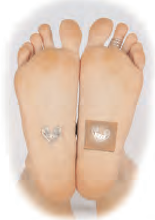
Fig. 1. Colocación del dispositivo